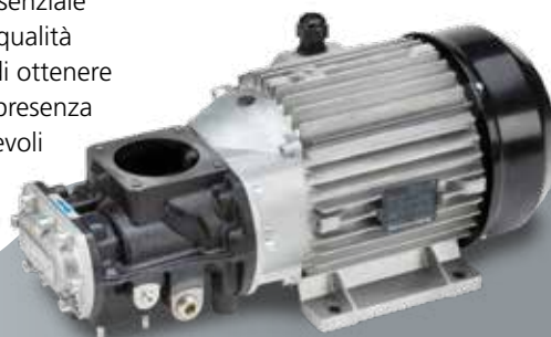
Gruppo vite FS 26TFC ad alta efficienza

I componenti soggetti a manutenzione ordinaria sono facilmente accessibili e rapidi da sostituire: assicurano lunghi intervalli di esercizio, mantenendo bassi i costi di manutenzione.